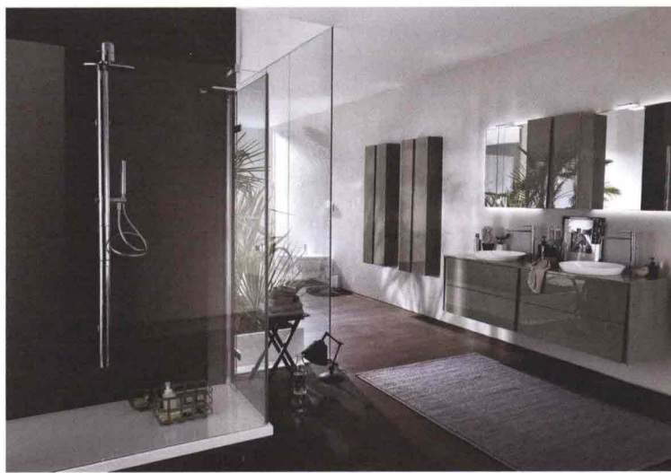
Ambiente bagno completo da una delle nuove collezioni.